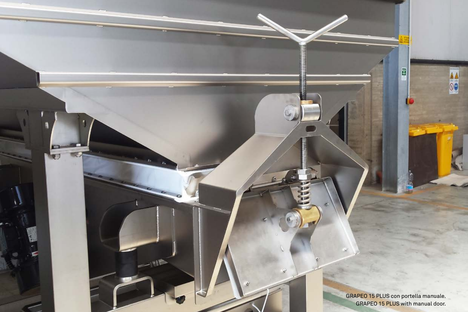
GRAPEO 15 PLUS con portella manuale. GRAPEO 15 PLUS with manual door.