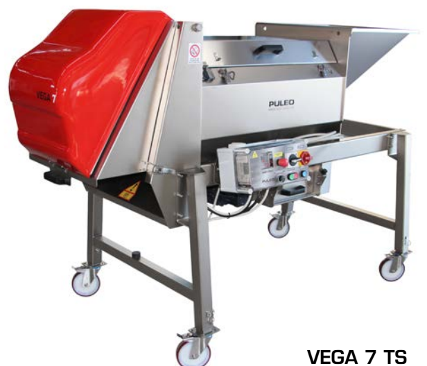
VEGA 7 TS