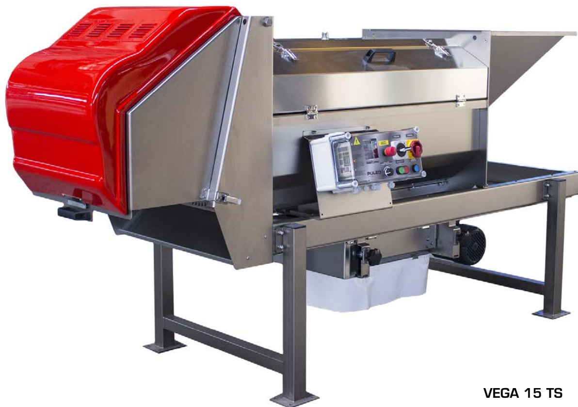
VEGA 15 TS

Vega 15 crusher has a different sliding system that takes places on two rails to allow horizontal displacement and to performs crushing/no crushing processes.