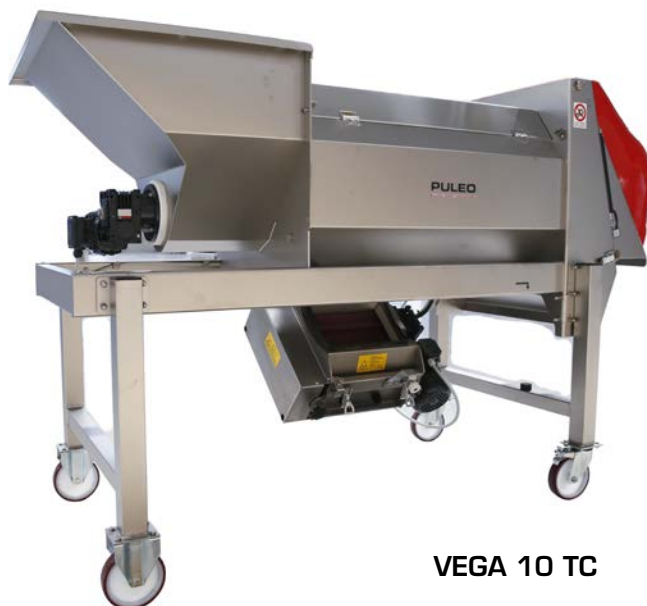
VEGA 10 TC

Available with simple hopper (TS) or hopper with screw (TC), as standard version.